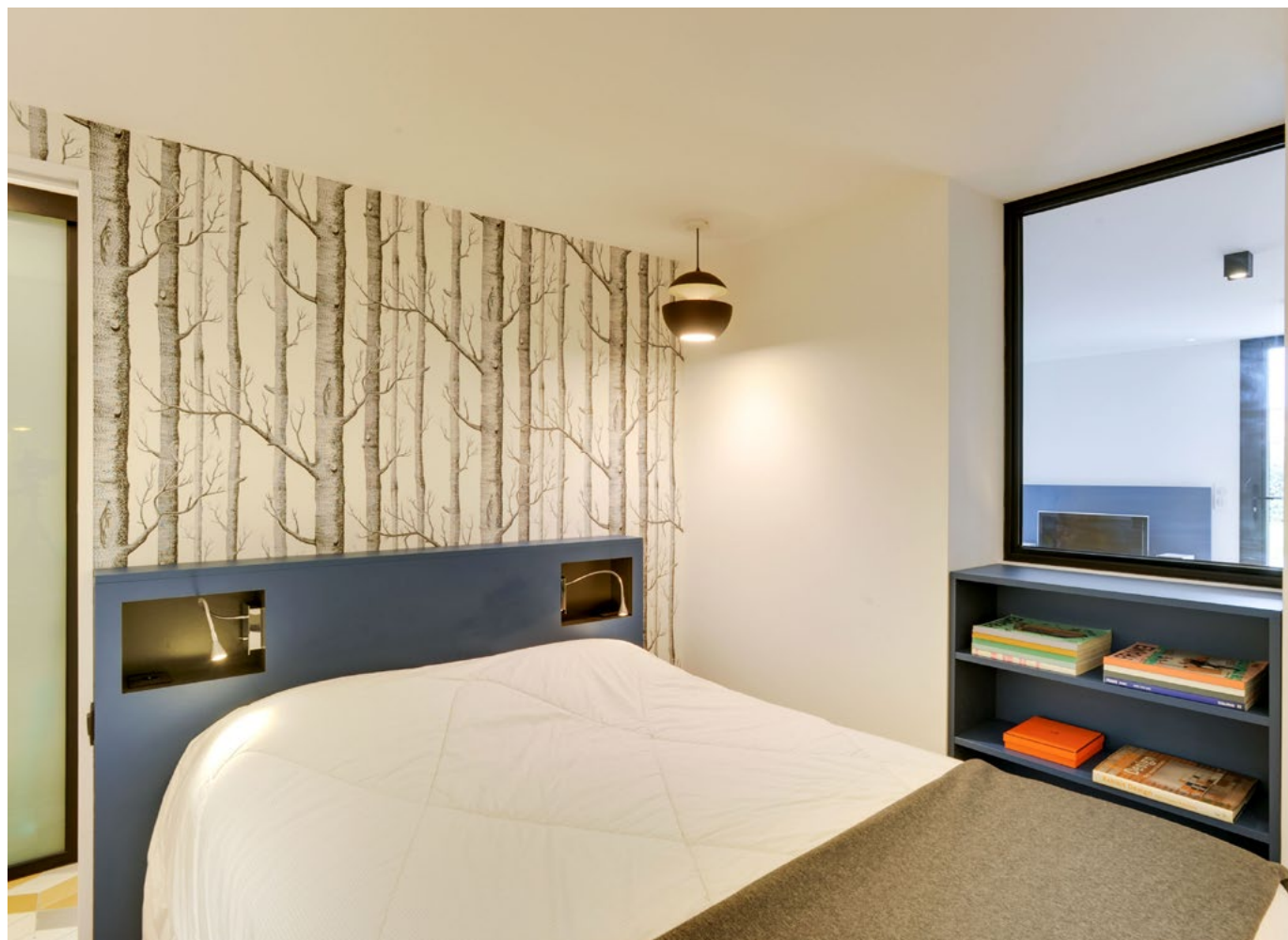
Côté lit , suspension chambre Here Comes the Sun créée en août 1970 par l'architecte toulousain Bertrand Balas et réédité par DCW éditions. Liseuses fournies par Agem placées dans des niches gris anthracite. Papier peint Woods de Cole & Son acheté chez Flanelle Décoration (Toulouse).