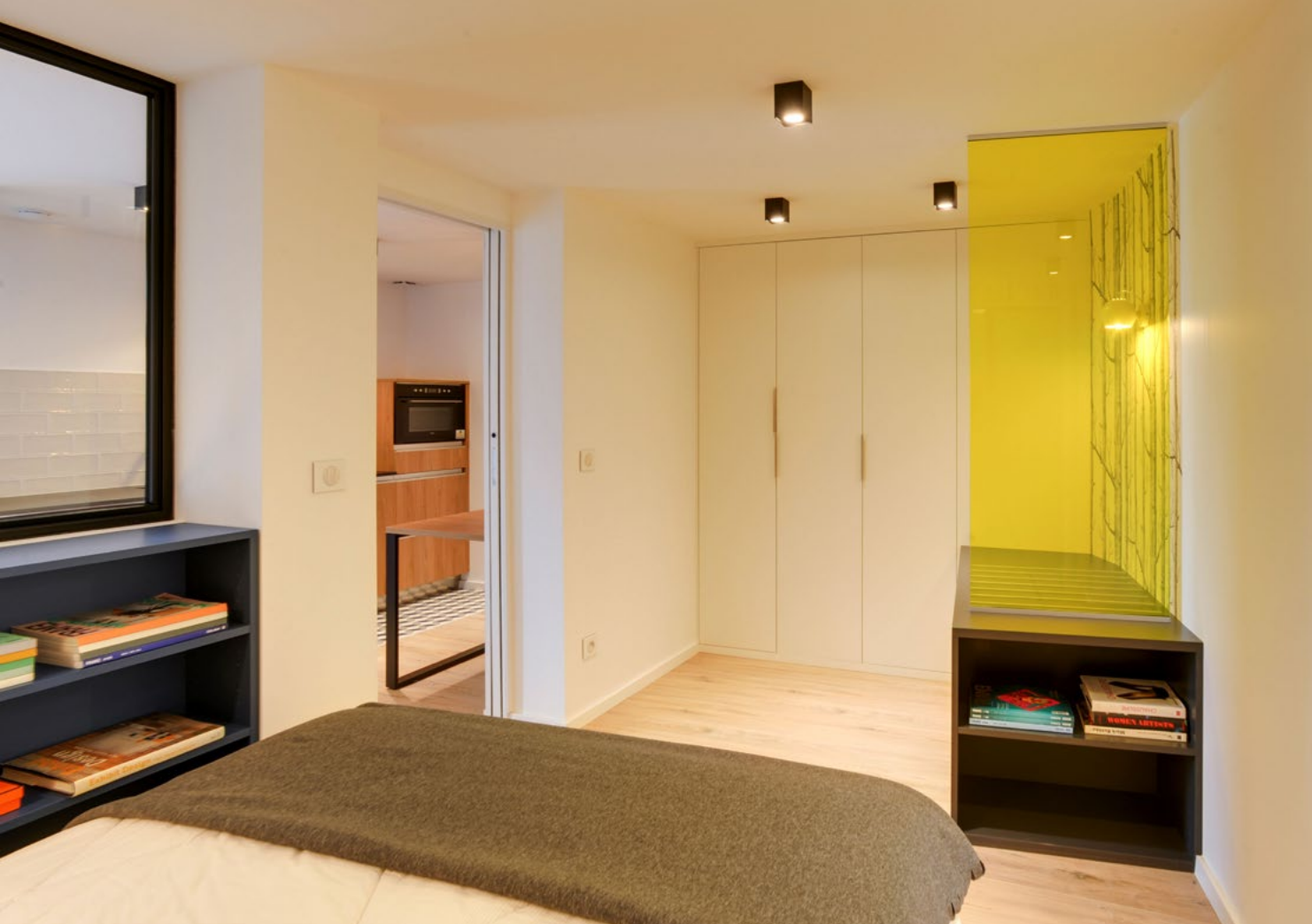
Côté penderie , applique Ball de chez Frandsen, réédition de 1969. Verre de séparation teinté jaune. Dressing et meuble porte-bagages sur-mesure par Agem (Balma).